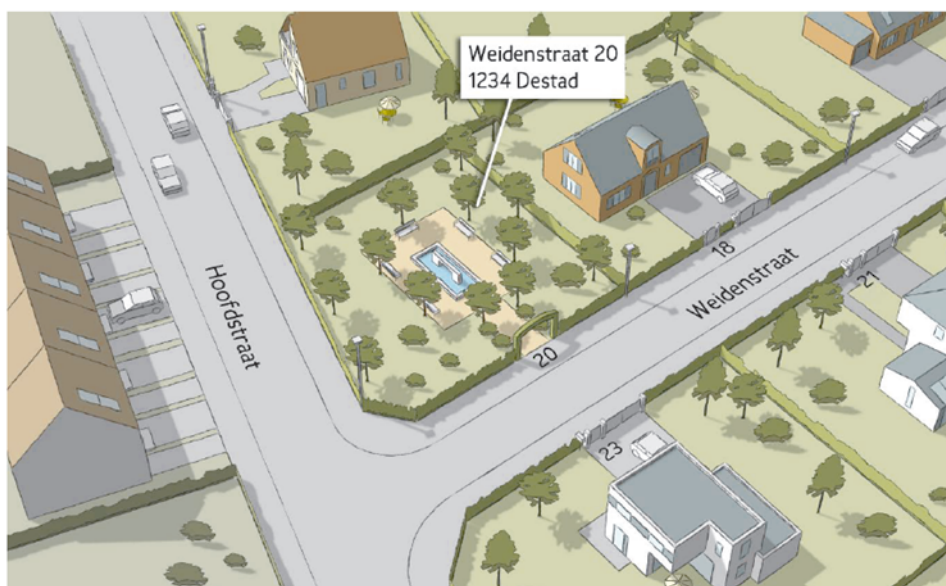
Figuur 63 - Park met een eigen adres zorgt voor een snelle identificatie door de hulpdiensten

Elke standplaats moet eveneens een huisnummer of desnoods een busnummer krijgen. (Artikel 10§5) (Figuur 63)